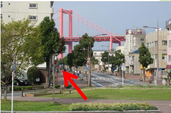
連絡通路を出たところの景色 橋に向かって左側を進む