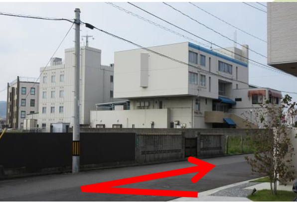
すぐ右側に見える建物がニスイマリン会館