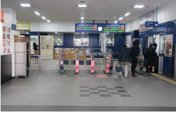
戸畑駅改札口 一カ所のみ