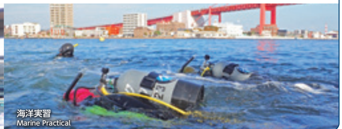
海洋実習 Marine Practical