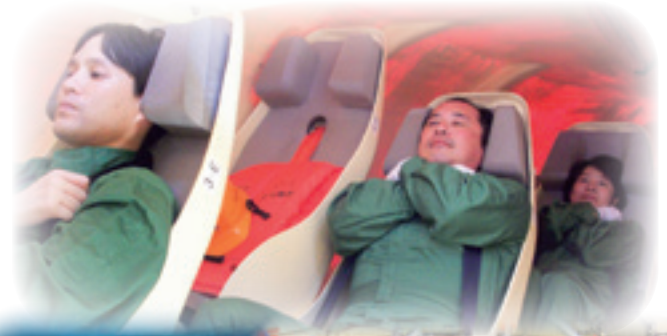
個々の生存技術 Proficiency in Personal Survival Techniques

This refresher training covers the required competence for recertification, every five years, in accordance with the STCW code. The course covers all requirements for recertification in "Personal Survival Techniques" and "Fire Prevention and Firefighting".