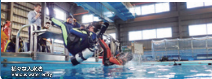
様々な入水法 Various water entry