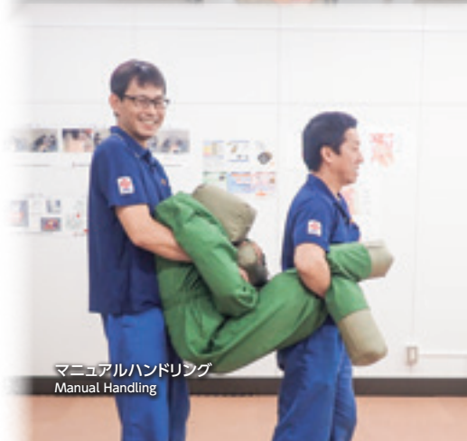
マニュアルハンドリング Manual Handling