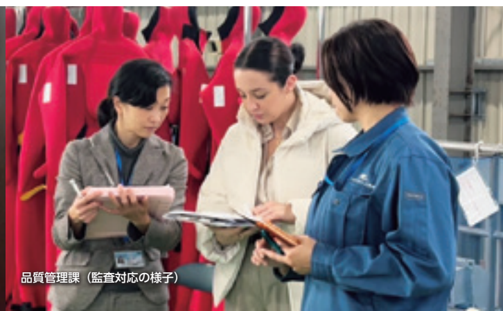
品質管理課 (監査対応の様子)