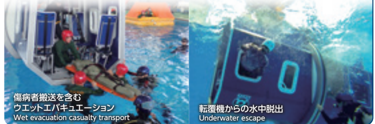
傷病者搬送を含む ウェットエバキュエーション Wet evacuation casualty transport

※EBS（非常用呼吸具）：水中からの脱出時間を持続させるための呼吸具 ※EBS（Emergency Breathing System）：Equipment which assists in underwater evacuation.