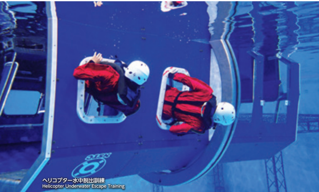
ヘリコプター水中脱出訓練 Helicopter Underwater Escape Training