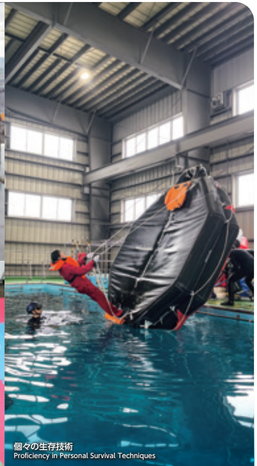
個々の生存技術 Proficiency in Personal Survival Techniques