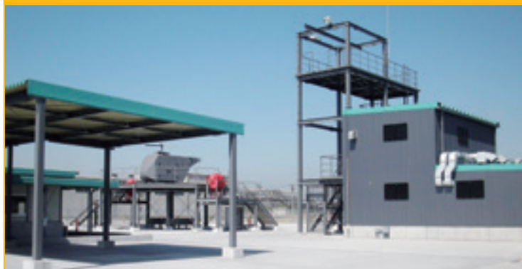
消火訓練ヤード / 模擬機関室&スモークルーム等 Fire Training Ground / Engine Room Simulator & Escape Training Room