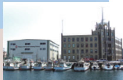
訓練棟・ニッスイ戸畑ビル Training Facility・NISSUI Tobata BLDG.