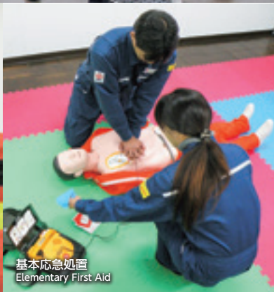
基本応急処置 Elementary First Aid

STCW条約は、「船員の訓練および資格証明並びに当直の基準に関する国際条約」です。2014年に日本で初めてSTCW条約基本訓練、2017年に基本訓練の更新訓練であるSTCW条約実地訓練の認証を日本海事協会から取得し提供を開始致しました。また、2017年には国交省から訓練機関として確認され、これまでに多くの方にご受講いただいております。