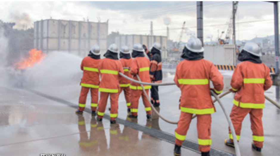
防火と消火 Fire Prevention and Firefighting