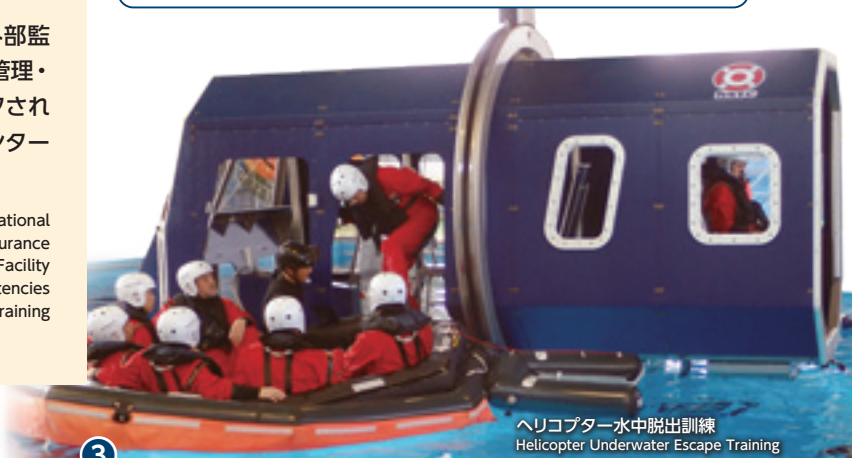
ヘリコプター水中脱出訓練 Helicopter Underwater Escape Training

Annual audits by external auditors are conducted for those international approval training such as OPITO, STCW and GWO. Quality Assurance Specialists regularly critique our Quality Management, Facility Management, Health & Safety Management systems and the competencies of our staff. Our center is recognized as one of the top-class training centers, worldwide.