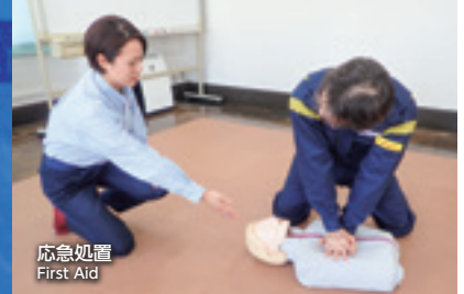
応急処置 First Aid