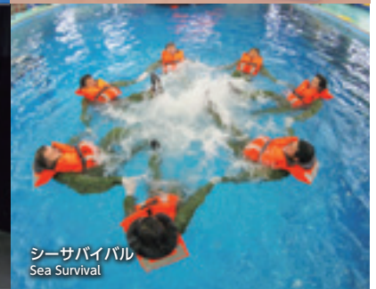
シーサバイバル Sea Survival

OPITO (Offshore Petroleum Industry Training Organisation) は作業者のサバイバル・スキルを向上させる訓練や安全な作業方法の基準を設けるために英国の石油開発業界が設立した国際組織です。世界中で基準の合理性が評価され、海洋資源開発事業に従事する場合はOPITO認証訓練施設で訓練を受講することを要求されることもあり、国内の一部調査船等においてもその国際基準が導入されています。NSTCは2011年に日本で初めてOPITO認証を取得しています。