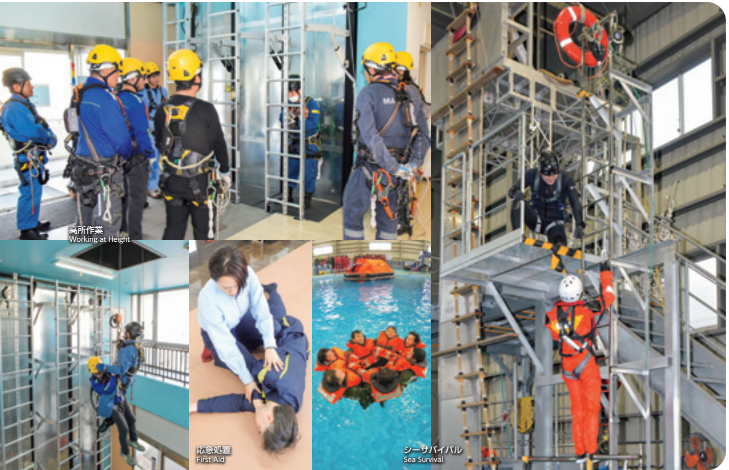
高所作業 Working at Height