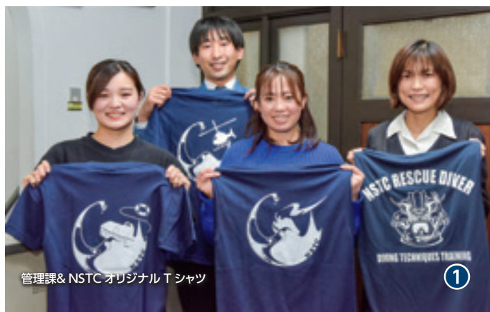
管理課& NSTC オリジナル T シャツ

NSTC provides training by Professional and Qualified Trainers with a variety of experiences. Continuous training and improvement by the entire staff ensure a safe and secure training for all delegates.