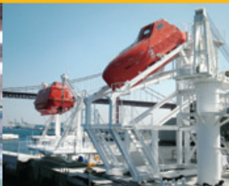
救命艇設備 Lifeboat Facility