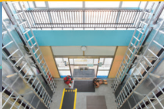
訓練用ラダー・緊急降下設備 Training ladders / Evacuation exercises facility