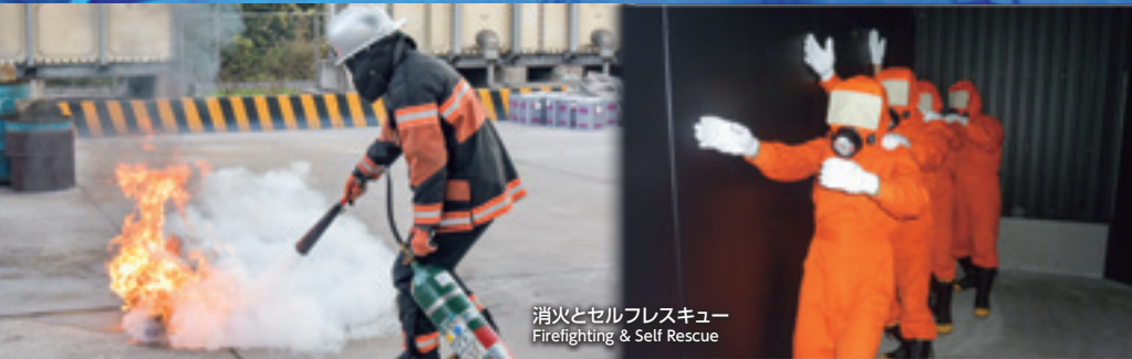
消火とセルフレスキュー Firefighting & Self Rescue