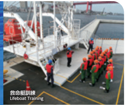
救命艇訓練 Lifeboat Training