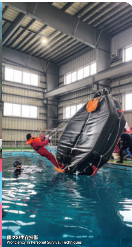
個々の生存技術 Proficiency in Personal Survival Techniques

STCW条約は、「船員の訓練および資格証明並びに当直の基準に関する国際条約」です。2014年に日本で初めてSTCW条約基本訓練、2017年に基本訓練の更新訓練であるSTCW条約実地訓練の認証を日本海事協会から取得し提供を開始致しました。また、2017年には国交省から訓練機関として確認され、これまでに多くの方にご受講いただいております。