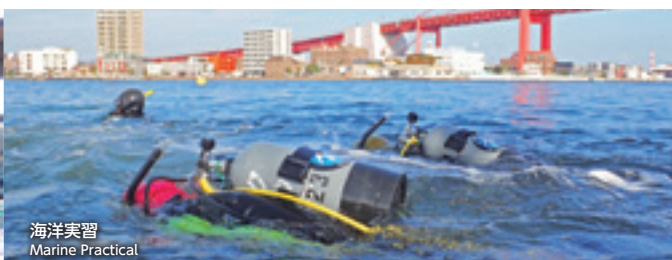
海洋実習 Marine Practical