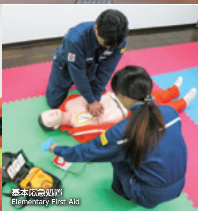
基本応急処置 Elementary First Aid