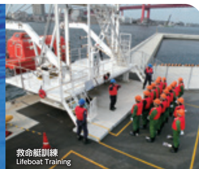
救命艇訓練 Lifeboat Training