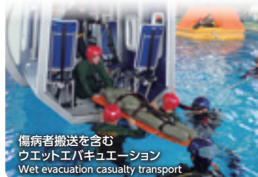
傷病者搬送を含む ウェットエバキュエーション Wet evacuation casualty transport

※EBS（Emergency Breathing System）：Equipment which assists in underwater evacuation.