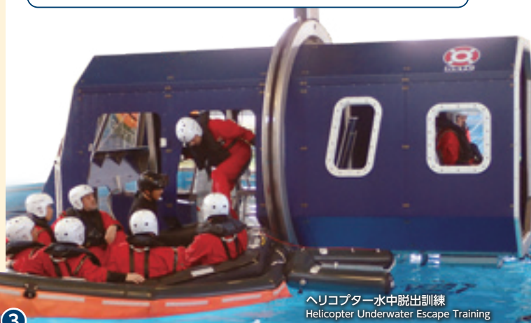
ヘリコプター水中脱出訓練 Helicopter Underwater Escape Training

Annual audits by external auditors are conducted for those international approval training such as OPITO, STCW and GWO. Quality Assurance Specialists regularly critique our Quality Management, Facility Management, Health & Safety Management systems and the competencies of our staff. Our center is recognized as one of the top-class training centers, worldwide.