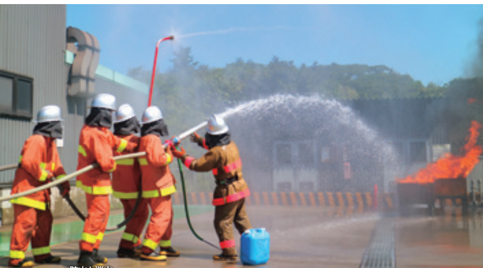
防火と消火 Fire Prevention and Firefighting