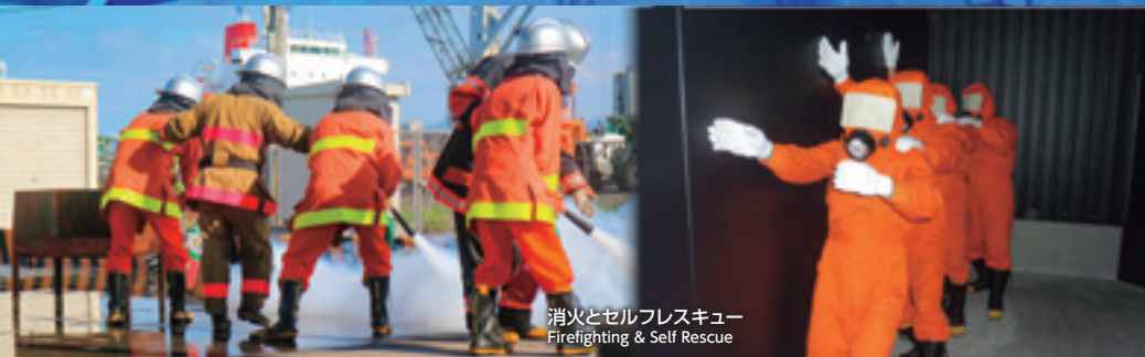
消火とセルフレスキュー Firefighting & Self Rescue