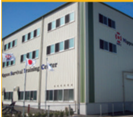
訓練棟 Training Facility