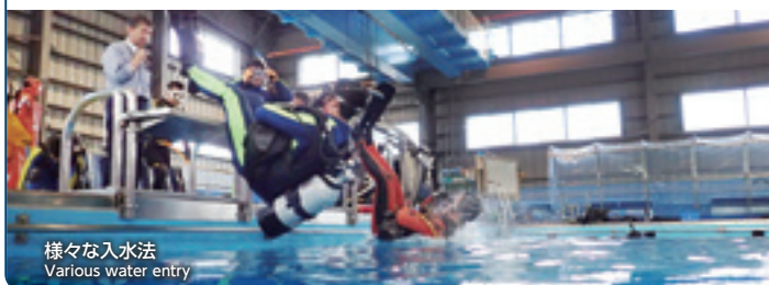
様々な入水法 Various water entry