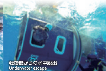
転覆機からの水中脱出 Underwater escape