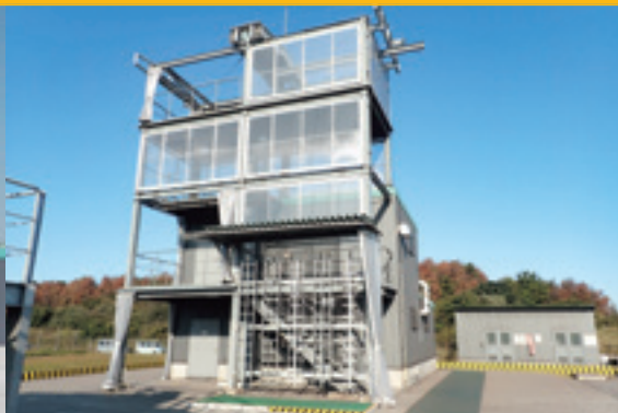
模擬機関室 / 模擬居住区画と高所作業訓練設備 Engine Room / Accommodation Simulator & Working at Height Training Facility