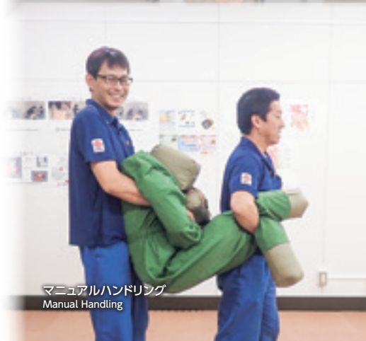
マニュアルハンドリング Manual Handling