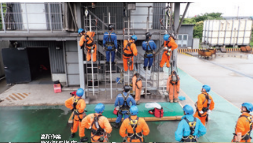
高所作業 Working at Height