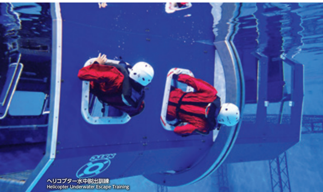
ヘリコプター水中脱出訓練 Helicopter Underwater Escape Training