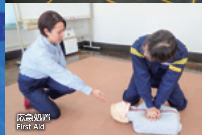
応急処置 First Aid