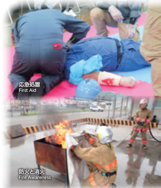
応急処置 First Aid

The GWO Basic Safety Training (BST) for personnel working in the wind industry consists of five modules, "Fire Awareness", "Working at Height", "Manual Handling", "First Aid" and "Sea Survival". It aims to build the knowledge and skills needed for the response to emergency situations and hazards specific to Wind Turbine Generators.