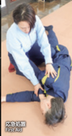
応急処置 First Aid