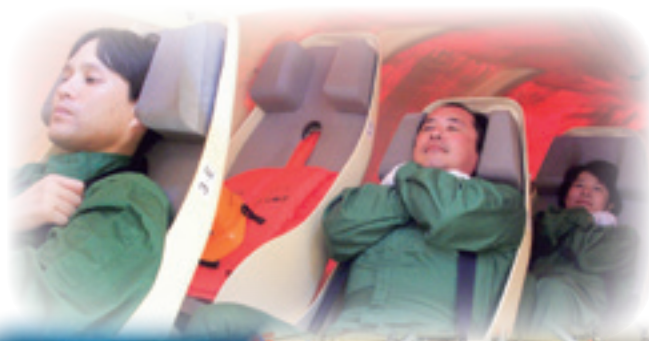
個々の生存技術 Proficiency in Personal Survival Techniques

This refresher training covers the required competence for recertification, every five years, in accordance with the STCW code. The course covers all requirements for recertification in "Personal Survival Techniques" and "Fire Prevention and Firefighting".