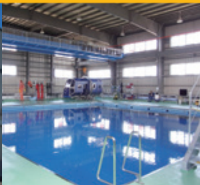
訓練用プール Training Pool