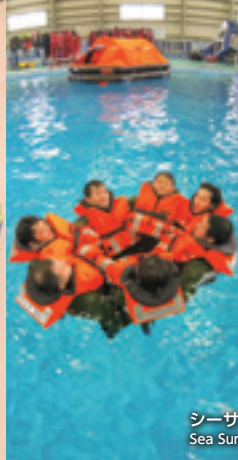
シーサバイバル Sea Survival