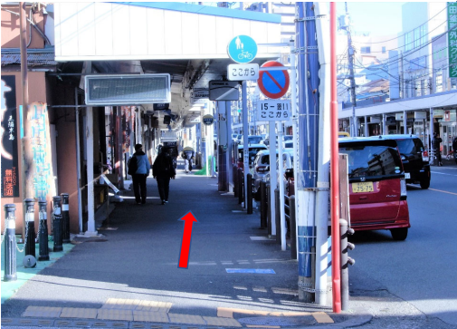
横断歩道を渡り約60m直進