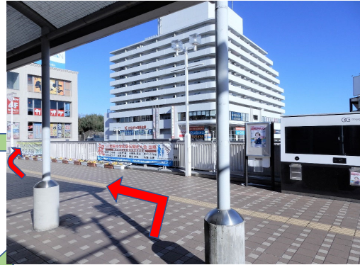
左に進み、突き当りを右に曲がる