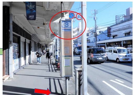
3番乗り場（日産研究所行き）