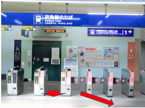
追浜駅改札口（一か所）出て左に進む